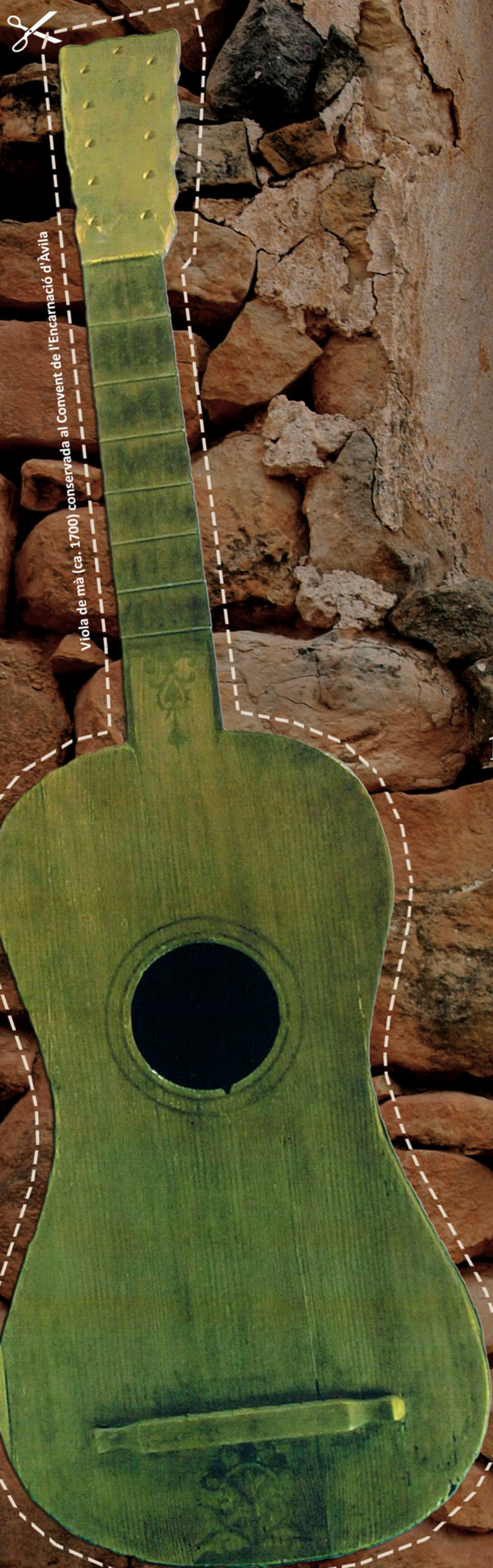
Viola de mà (ca. 1700) conservada al Convent de l'Encarnació d'Àvila

Ds. JUNEDA 14 set. | Mas Miravall 21.00 h | JAUME TORRENT